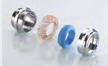
Abb. 2 Fig. 2

Messing verchromt, Feder aus Bronze (nicht magnetisch) Metrisches Gewinde DIN 89280 (Marine) Mit O-Ring HNBR Schutzart IP 68 bis 15 bar, IP 69 Zugentlastung bis Klasse B, EN 62444