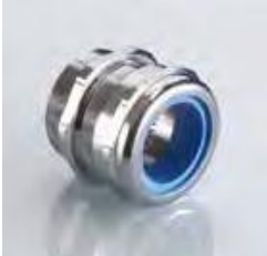
Abb. 1 Fig. 1