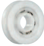
xirodur® B180-Käfig, Edelstahlkugeln Typ 608P6