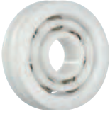
xirodur® B180-Käfig, Edelstahlkugeln Typ 6000PP3