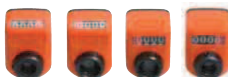
A* B C D