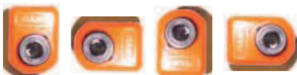
0 Grad 90 Grad 180 Grad 270 Grad