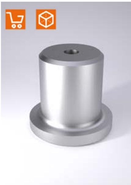
Esempio di montaggio